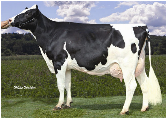
COYNE-FARMS RAMOS JELLY THIRD DAM